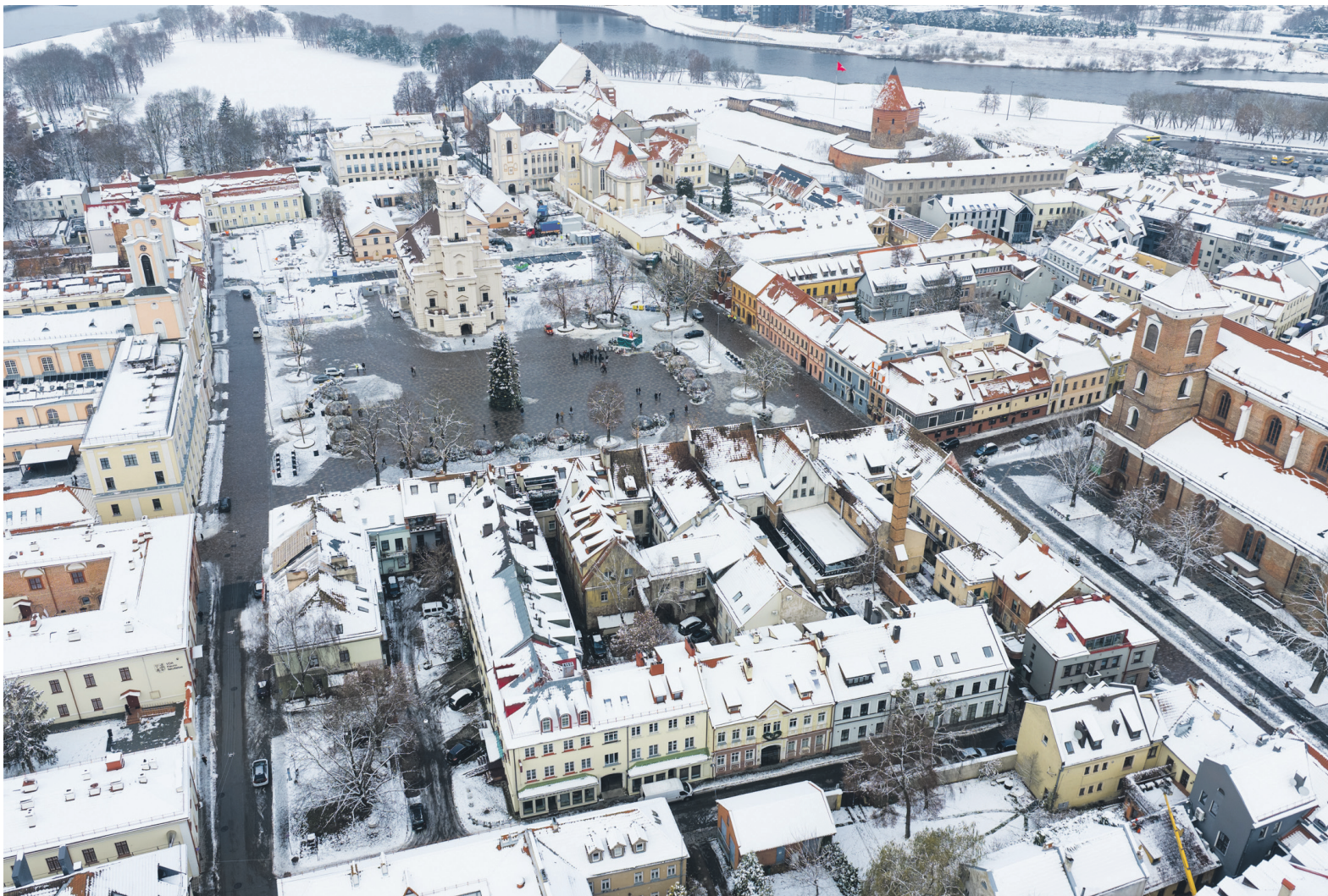
■ Tikslas: STZ zonos skirtos tranzitiniam transporto srautui mažinti gražiausioje miesto dalyje.