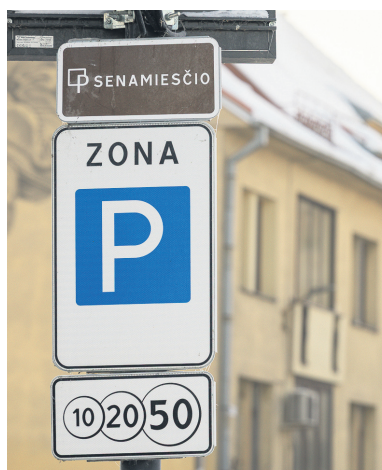
■ Apmokėjimas: vairuotojams, kurie lankosi Senamiestyje, STZ mokestis įeina į parkavimo mokestį.

Numatytos ir STZ lengvatos. Jos taikomos gyvenamąją vietą STZ zonoje deklaravusiems ar čia nekilnojamojo turto turintiems žmonėms, neįgaliesiems, specialiųjų tarnybų transportui, taksi, kurjeriams. „Tačiau šioms lengvatoms rei-