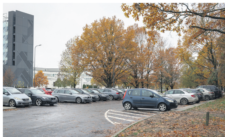
■ Parkavimas: Studentų miestelio priegose, netoli KTU „Santakos“ slėnio (K. Baršausko g. 59), miesto savivaldybė įrengė naują automobilių stovėjimo aikštelę.

Minėtų pokyčių įsigaliojimo data bus paskelbta viešai po tarybos sprendimo priėmimo, tad vairuotojai turi sekti informaciją ir stebėti kelio ženklus, nurodančius apie mokamas parkavimo vietas.