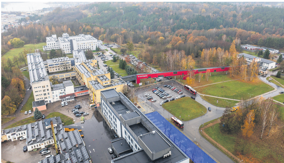
■ Ligoninė: apmokestinama tik viena aikštelė Skubios traumatologijos pagalbos skyriaus priegose. Likusios parkavimo vietos – nemokamos.